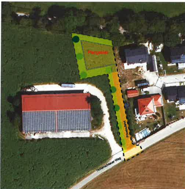
Luftbild und Flurkarte mit Plangebiet unmaßstäblich

Der Geltungsbereich umfasst eine Teilfläche der Flurnummer 294 (Plangrundstück) sowie eine Teilfläche der Flurnummer 259 (Hohenschlauer Weg), jeweils Gemarkung Unterrieden (Geltungsbereich), am westlichen Ortsrand des Ortsteils Unterrieden der Gemeinde Oberrieden, nördlich des Hohenschlauer Wegs gelegen.